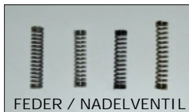
FEDER / NADELVENTIL